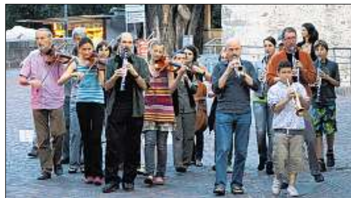
Qua as vezza ils participants al lavuratori a Gluorn pro'l concert tras cità.