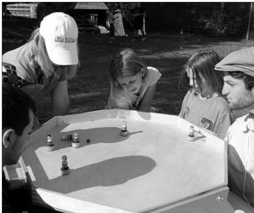
La lavur da team denter ils affons duei vegnir promovida durant il camp.