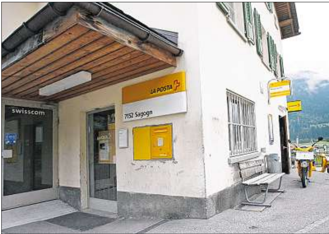
Denter las 47 postas dil Grischun che ein periclitadas sesanfla era la posta da Sagogn.

La regenza conceda ch'il diember d'emploiai da posta seigi sesmi-