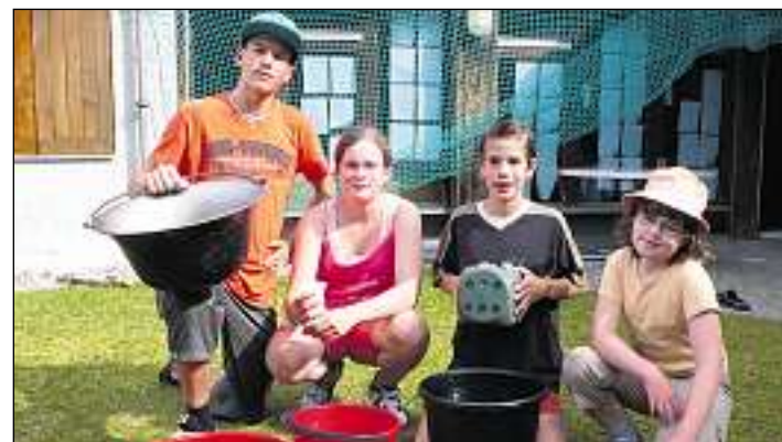
Affons cun impediment dall'udida fan vacanzas a Valata (Sursaisa).