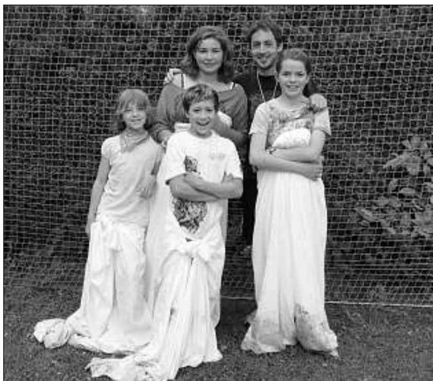
Ina dallas disciplinas dil di da giugs: Seglir cun in lenziel entuorn veta.