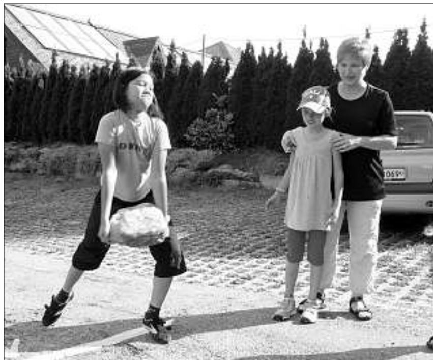
Duront il di da giugs ston ils affons denter auter mussar ch'els han forza.